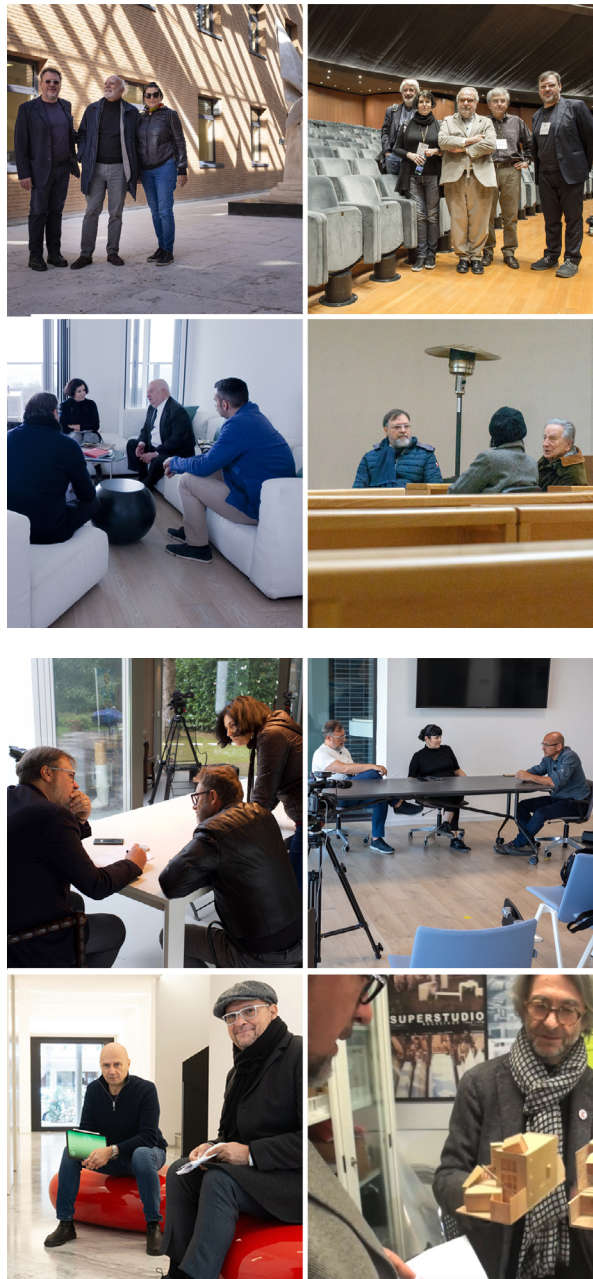
Figg. 2, 3

Ludovico Romagni, gli scatti di Enter_Vista.