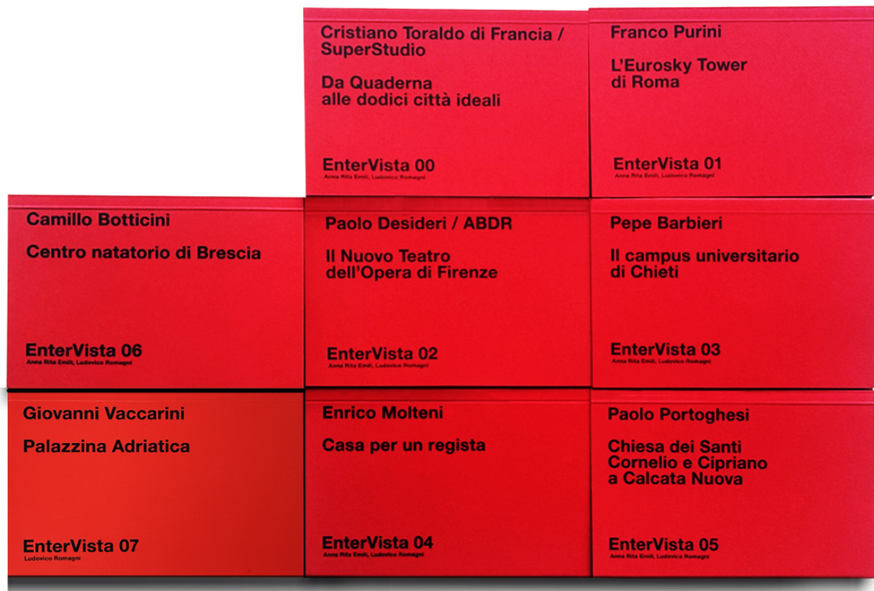
Fig. 5 I 'tascabili' di Enter_Vista, editi da Plug_in.

video offre l'opportunità di riflettere sul rapporto tra progetto di architettura e forme di comunicazione nel passaggio dalla carta stampata al web. Oggi, questo sistema si intreccia con un multiverso mediatico estremamente diversificato che ha trasformato tanto i linguaggi quanto i contenuti. Recenti sondaggi ci dimostrano come tra gli studenti di architettura l'uso del digitale, come fonte di acquisizione delle informazioni, stia diventando predominante, quasi univoco.