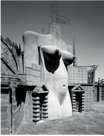
Fig. 1 Vista delle Mure esterne con “La Grande Madre” (Fotografia di Matteo Benedetti, 2012).

razione, più propriamente compositiva, si intrecciano contenuti sedimentati (norme e forme tramandate) e innovazione; in ultimo, nella rfigurazione, il racconto si offre come strumento di decifrazione e di interpretazione del mondo (Rocca, 2008).