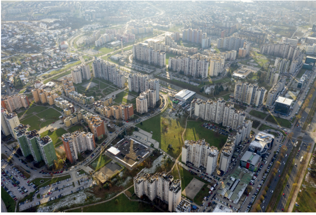
Fig. 5 Il complesso residenziale di Alipasino polje.