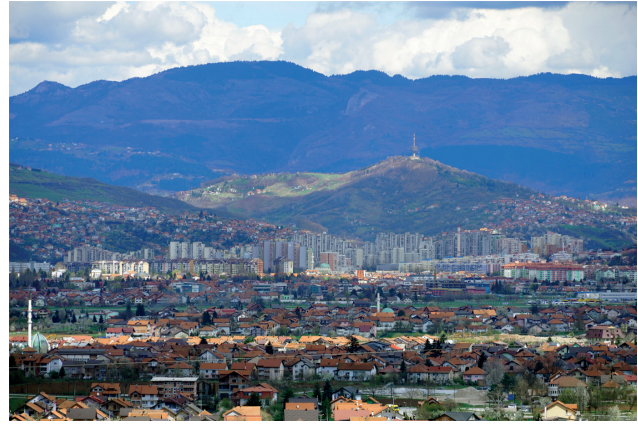
Fig. 6 Vista di Alipasino polje dal monte Igman. Foto di Emina Zejnilović, 2023.

L'aspetto di "chiusura" creato verso l'esterno, viene intelligentemente ammorbidito con la regolazione della scala del costruito e con il livellamento di grandi aree pubbliche, che con la loro orizzontalità bilanciano l'esagerata verticalità degli edifici che li cingono. Il progetto prevede inoltre numerosi spazi comuni pensati per incentivare il culto del vicinato e il senso di comunità.